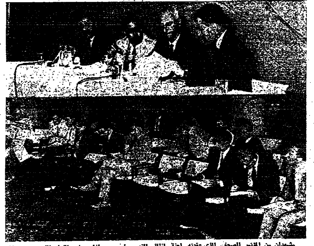
مشهدان من المؤتمر الصحفي الذي عقده لجنة انتقال القدس أمس وأذاعت فيه القاء الذي وجهه سكان القدس إلى الصيغ المالي والإقتصادية العربية